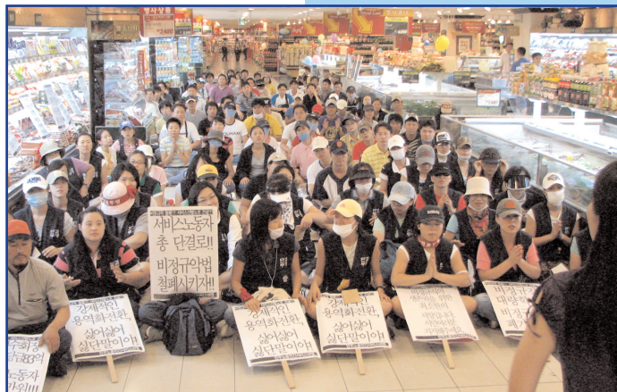
Kamp för jobben - sittstrejk på E-Landaffär i Sydkorea

Handelsanställda medlemmar i KCTU i Sydkorea ockuperade E-Landaffärer för att rädda jobben för 1000 deltids- och kontrakt-sanställda som sades upp just innan nya lagar skulle ha gjort det lättare för dem att övergå till heltidsjobb. Uppsägningarna skedde trots att en arbetsdomstol beslutat att de var oskäligen. E-Land tog över Carrefour Korea med sysselsättningsgarantier. Fackliga funktionärer har redan hotats med gripanden. UNI kräver att de uppsagda omedelbart återinsätts. (uni-asiapacific@uniglobalunion.org)