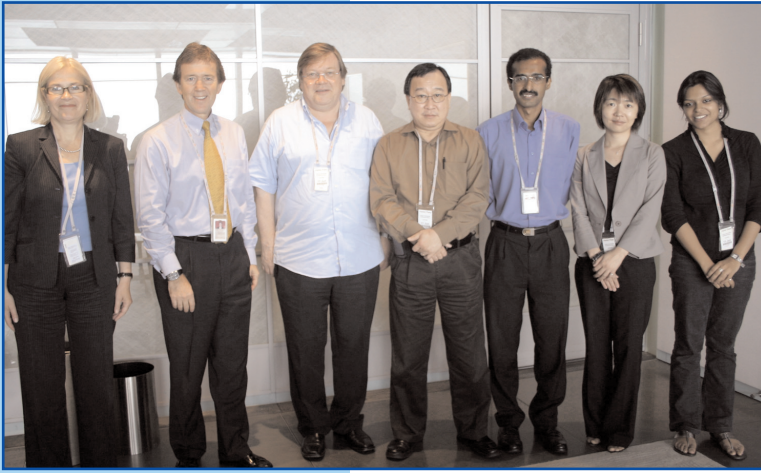
HSBC-chefer med representanter för UNI-Apro i Hongkong i juni