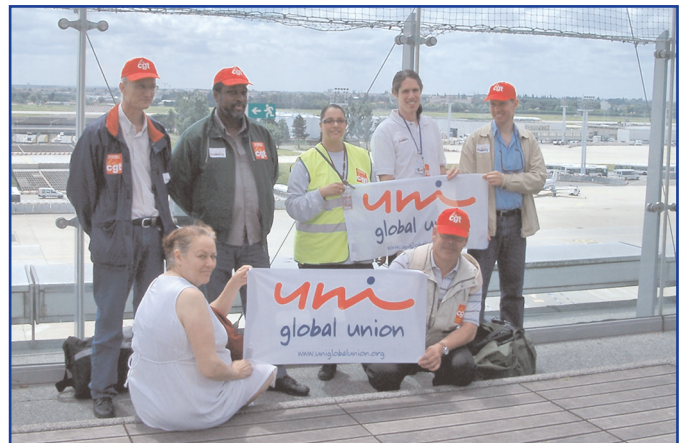
Nedan: Flygplatsanställda på Orly i Frankrike kräver rättvisa för städpersonal och väktare