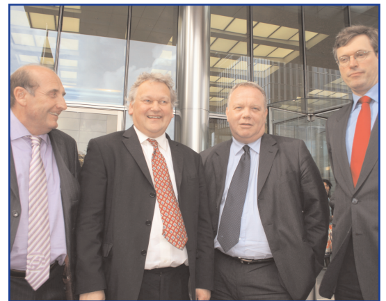
Ovan: Medlemmar i UNI Finans delegation efter deras möte med Barclays vd

Internationella rättvisedagen för fastighetsskötare, som anordnas den 15 juni, har varit en stor framgång, med verksamheter i 43 städer och 17 länder. Det anordnades demonstrationer och stormöten, namninsamlingar och andra manifestationer för att sprida budskapet om rättvisa för städare och väktare. 300 städare i Kongo Kinshasa fick tv-uppmärksamhet med sin uppmaning att "kämpa för hälsa och välfärd". I Belgien stoppade väktare arbetet, vilket ledde till att flygningar måste ställas in, för att visa vilken viktig roll som spelas av bevakningstjänsterna. (christy.hoffman@uniglobalunion.org)