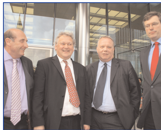
Ci-dessus: les membres du groupe d'UNI Finance après une réunion avec le PDG de Barclay

La Journée internationale pour la justice, qui se tient chaque année le 15 juin, a eu un grand succès, avec des activités menées dans 43 villes et 17 pays. Des rassemblements, manifestations, pétitions et célébrations ont fait passer le message de la justice au travail pour les nettoyeurs et les gardes de sécurité. 300 nettoyeurs en RD du Congo scandant leur "lutte pour la santé et le bien-être" sont passés à la télévision. En Belgique, des agents de sécurité ont arrêté le travail, provoquant l'annulation de vols et prouvant ainsi le rôle essentiel des travailleurs de la sécurité. (christy.hoffman@uniglobalunion.org)