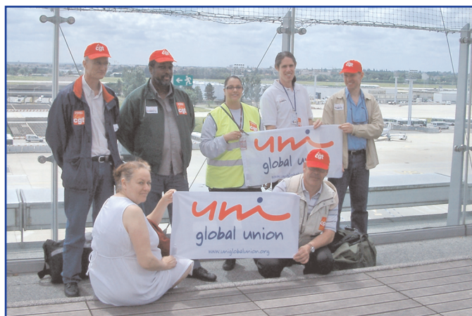
Ci-dessous: En France, les travailleurs d'Orly Aéroport demandent justice pour les nettoyeurs et gardes de sécurité