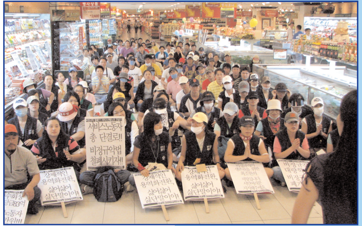
Ils luttent pour leurs droits - Sit-in chez E-Land en Corée

En Corée du Sud, des travailleurs du commerce du KCTU ont occupé les magasins ELand pour protester contre le licenciement de 1000 travailleurs à temps partiel et en sous-traitance, juste avant la promulgation de nouvelles lois qui auraient facilité leur passage à des postes à plein temps. Ces licenciements ont eu lieu alors que la Commission du travail les avait jugés abusifs. ELand a racheté Carrefour Corée en garantissant les emplois. Des permanents syndicaux ont déjà été menacés d'arrestation. UNI appelle à la réintégration immédiate des travailleurs. (uni-asiapacific@uniglobalunion.org)