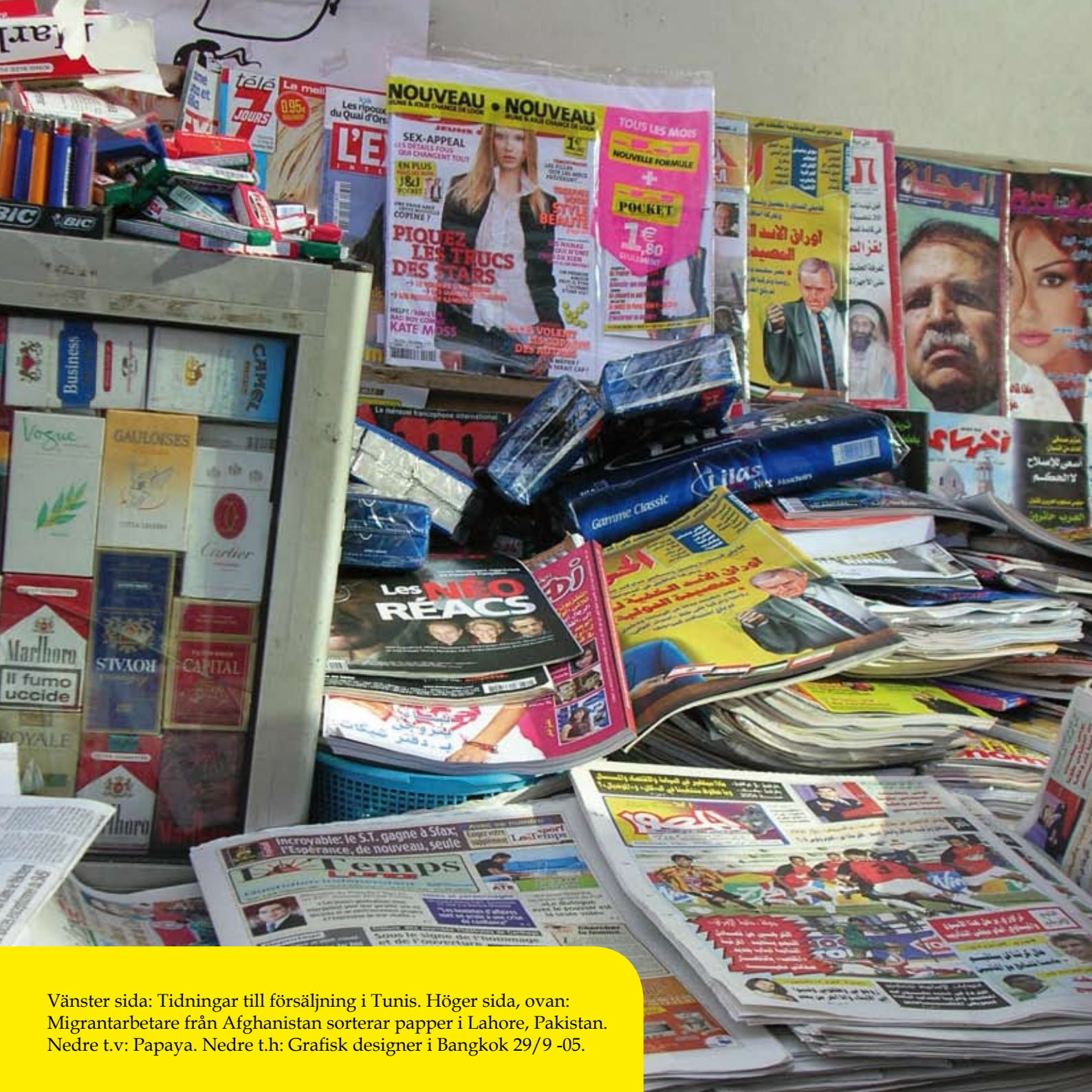
Vänster sida: Tidningar till försäljning i Tunis. Höger sida, ovan: Migrantarbetare från Afghanistan sorterar papper i Lahore, Pakistan. Nedre t.v: Papaya. Nedre t.h: Grafisk designer i Bangkok 29/9 -05.