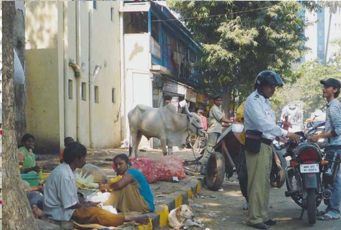
Bombay 8/2 - 09.