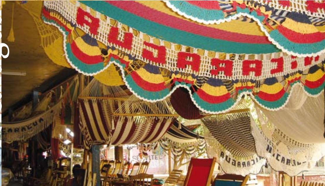
Fotograf Rebecca Selberg. Bilden är tidigare publicerad i tidningen Mana.