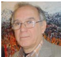
José Estigarríbia Översättning Spanska Grafiska Fackförbundet