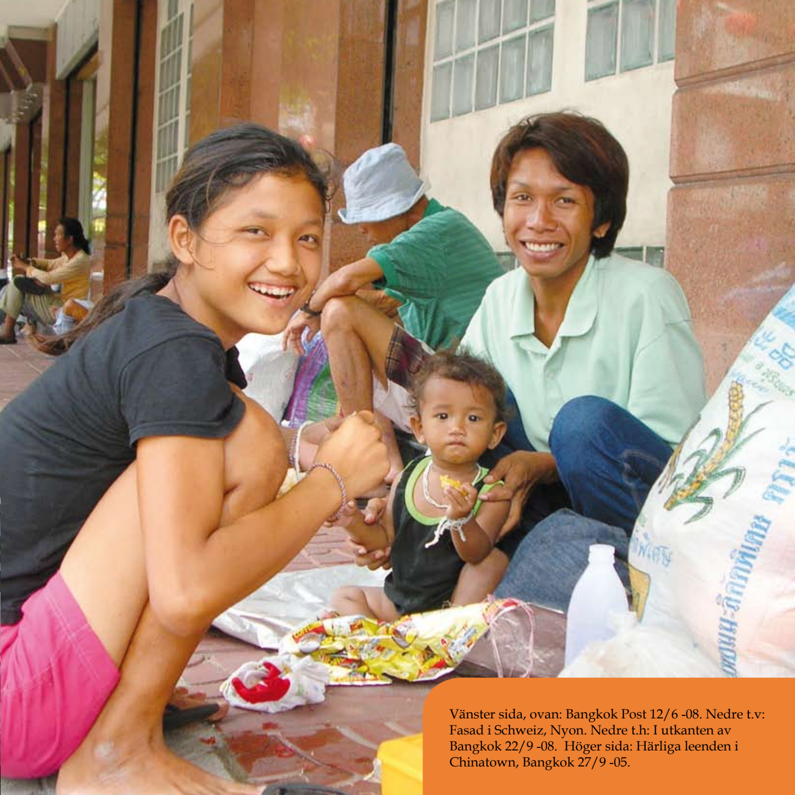
Vänster sida, ovan: Bangkok Post 12/6 -08. Nedre t.v.: Fasad i Schweiz, Nyon. Nedre t.h: I utkanten av Bangkok 22/9 -08. Höger sida: Härliga leenden i Chinatown, Bangkok 27/9 -05.