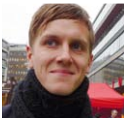
Johan Eureníus Översättning Engelska