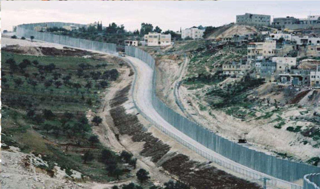
Abu-Dis utanför Jerusalem. Muren är byggd långt inne på ockuperat område.