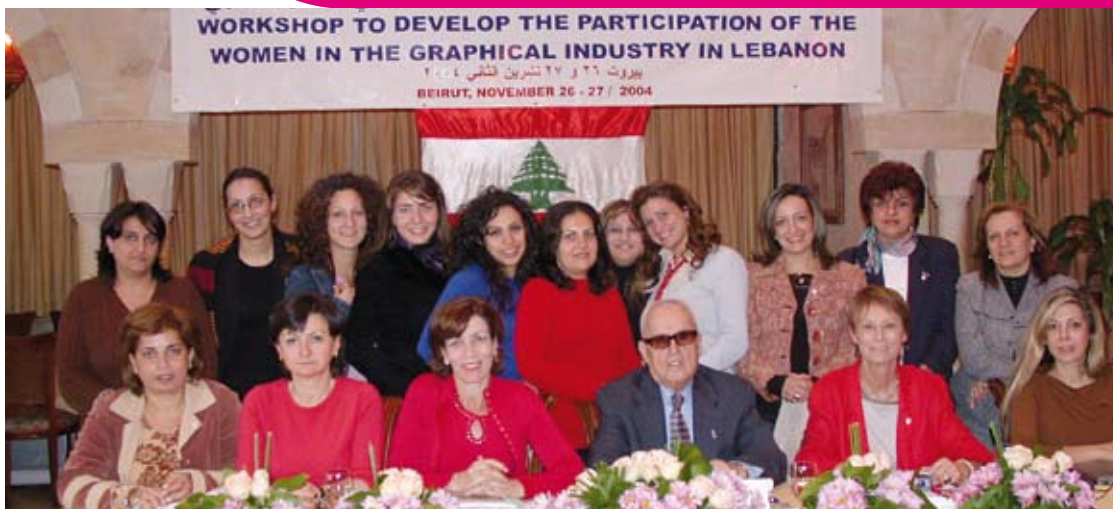
Jämställdhetsutbildning i Beirut, GF, UNI och Lebanon Printers and Bookbinders Union. Beirut 27/11 -04.