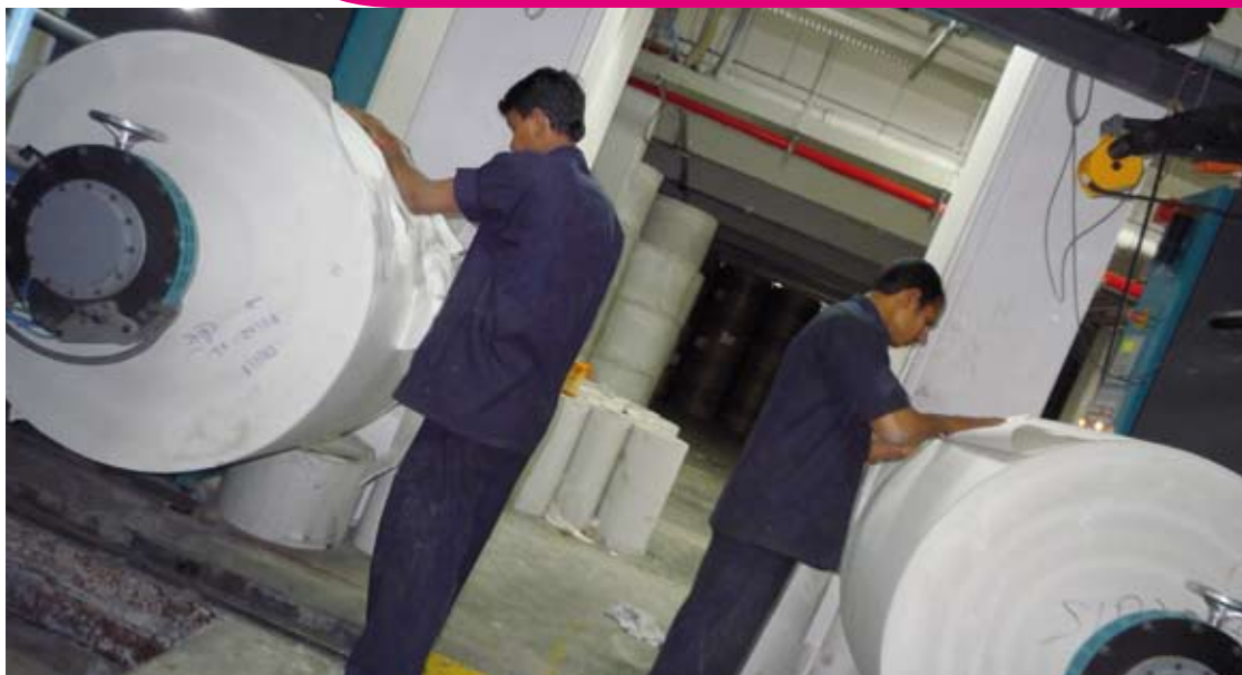
Rullkällaren i Saakals tryckeri utanför Pune 10/2 -09.